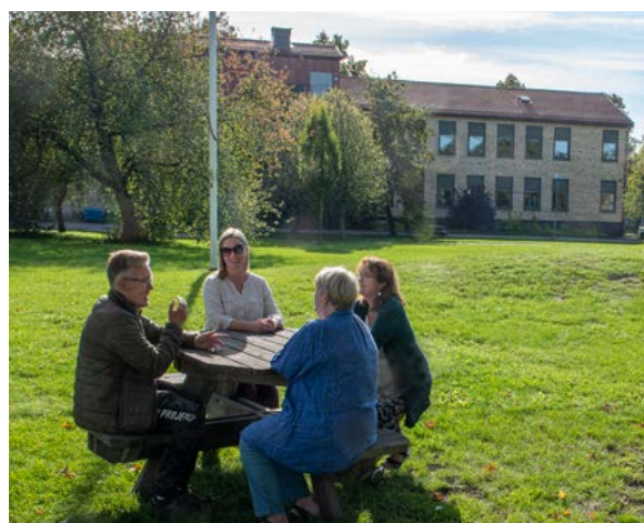
Så här ser det ut på innergården.