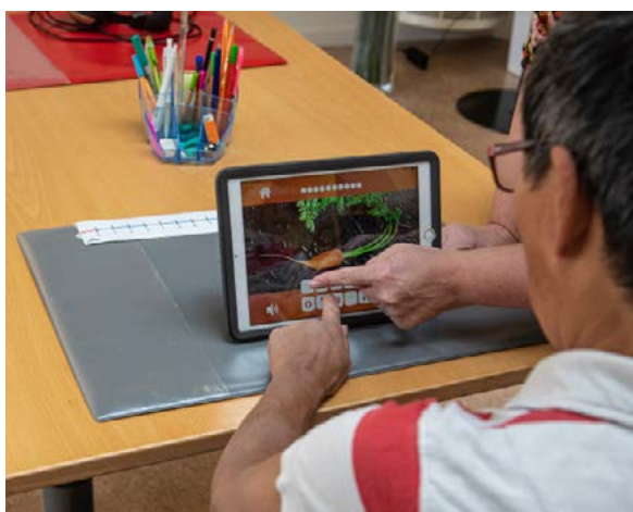
Vi arbetar med digitala verktyg.