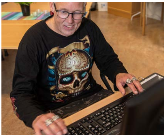
Det finns flera datorer i klassrummen.